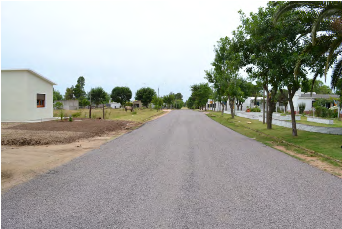
Municipio: Casupá - Departamento: Florida - Obra: Pavimentación de calles Barrio MEVIR