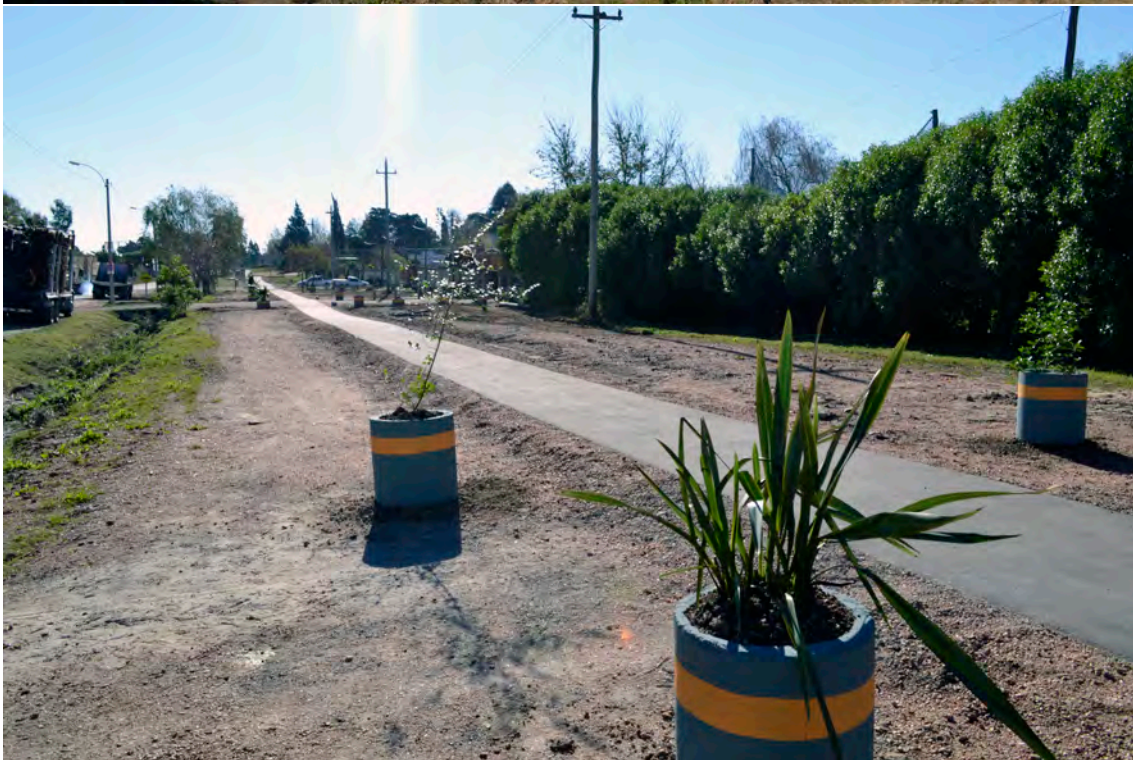
Municipio: Los Cerrillos Departamento: Canelones Obra: Ciclovía