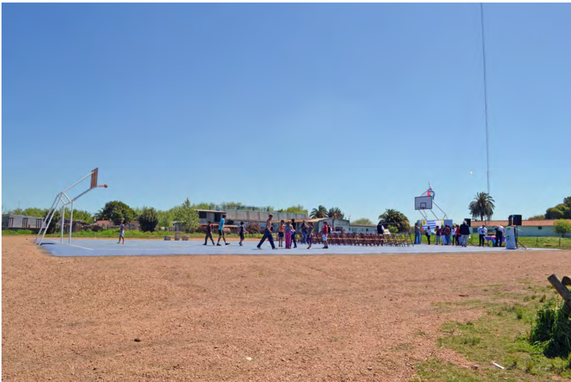
Municipio: Barros Blancos - Departamento: Canelones - Obra: Polideportivo