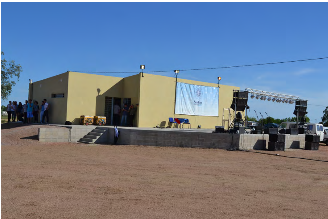
Municipio: Ciudad del Plata - Departamento: San José - Obra: Espacio Comunitario