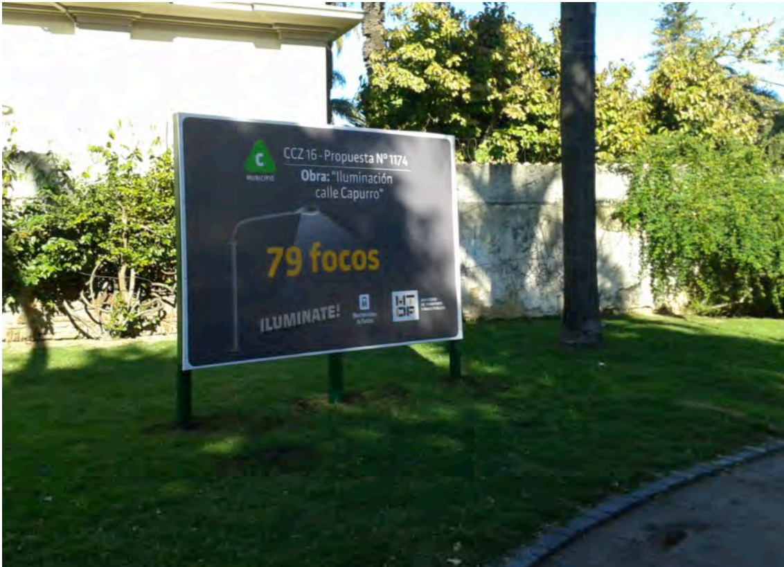
Cartel de obra – Realizar 2012

La edición 2013 es una muestra clara de la confianza y el prestigio que ganó el programa en sus anteriores ediciones por la cantidad de votos obtenidos: 49.119 y también de las propuestas seleccionadas 283 que están llevándose a cabo en este momento.