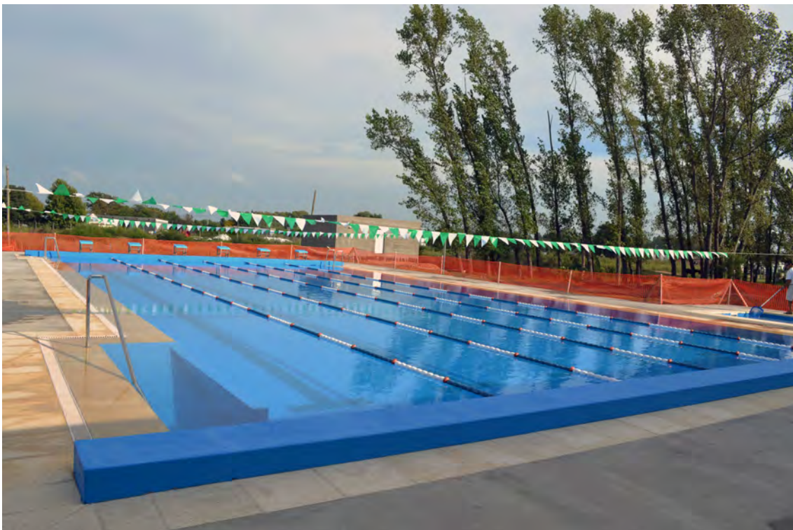
Municipio: Dolores - Departamento: Soriano - Obra: Piscina Pública