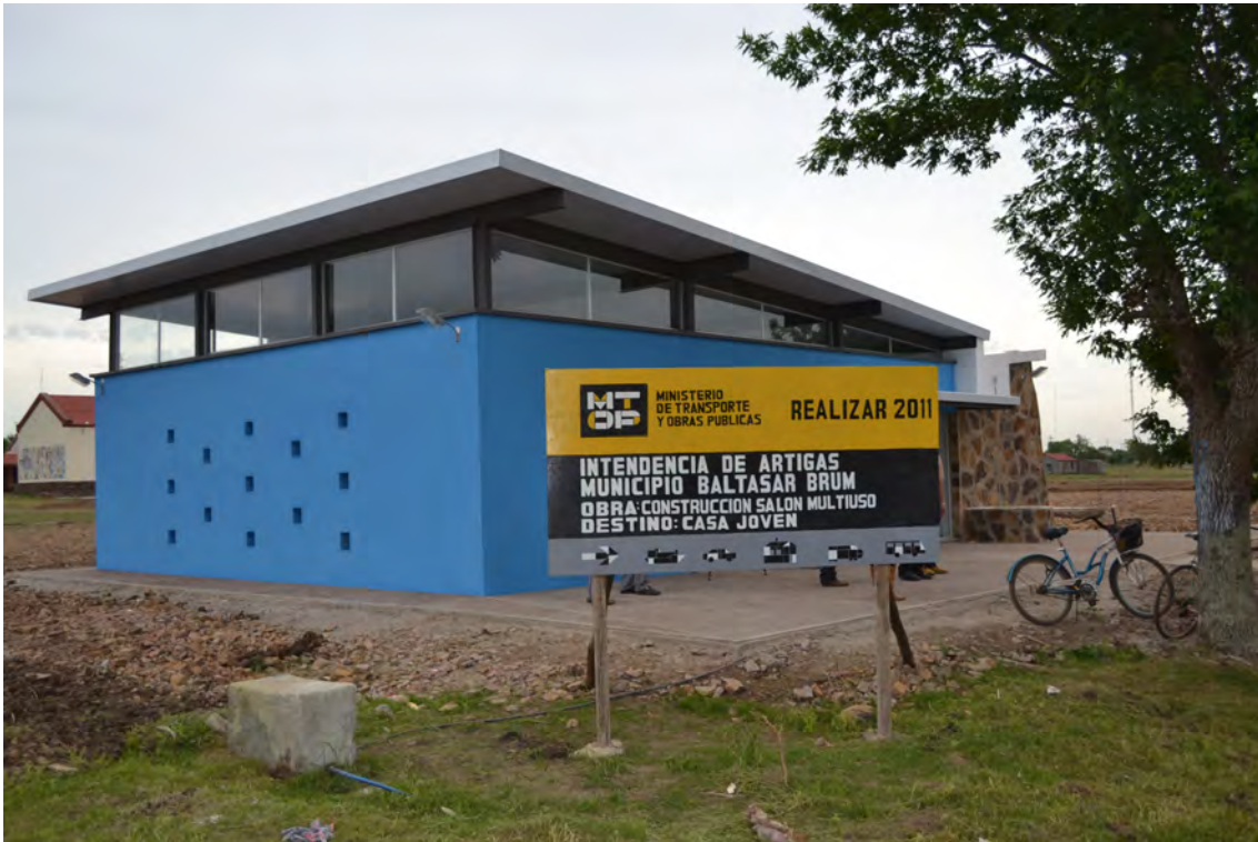
Municipio: Baltasar Brum - Departamento: Artigas - Obra: Casa Joven