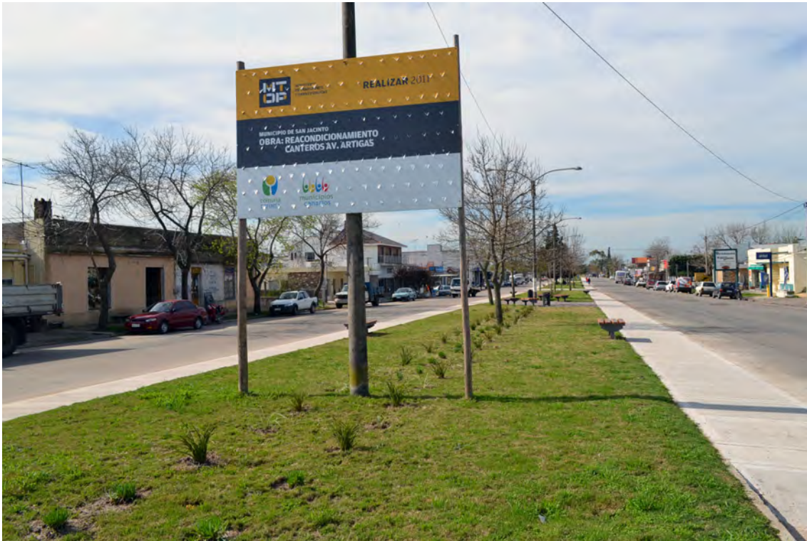
Municipio: San Jacinto - Departamento: Canelones - Obra: Acondicionamiento urbano