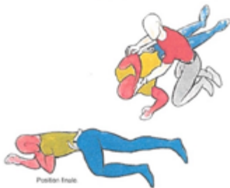
Imagen: Federación de socorristas franceses Cruz Blanca, ilustración de Jean-Pierre Danard